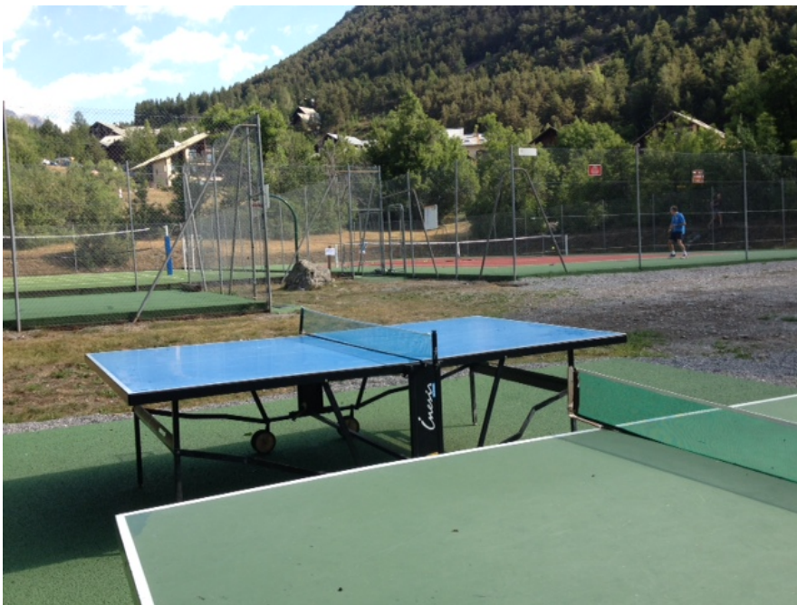
L'espace de loisirs