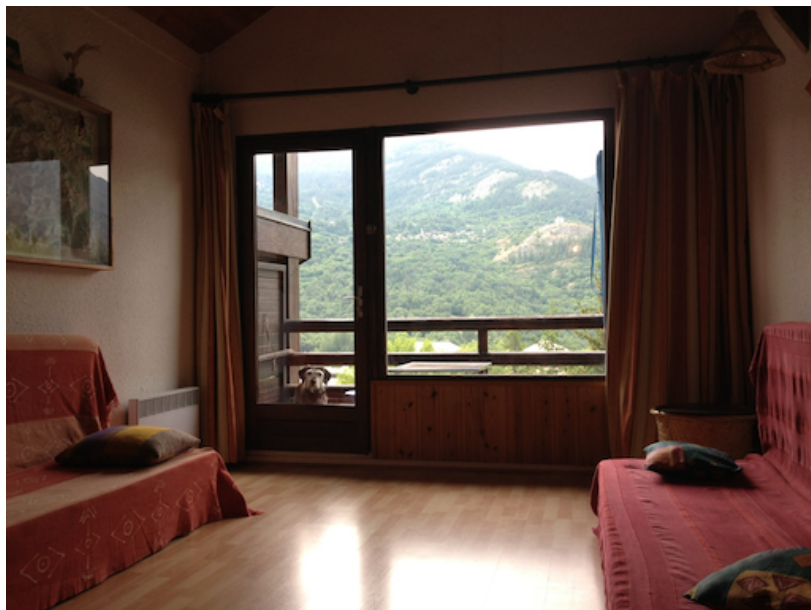
Le séjour (vue de la cuisine)