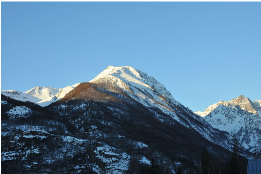
Le vallon de Narreyroux, la pointe de l'Aiglier,