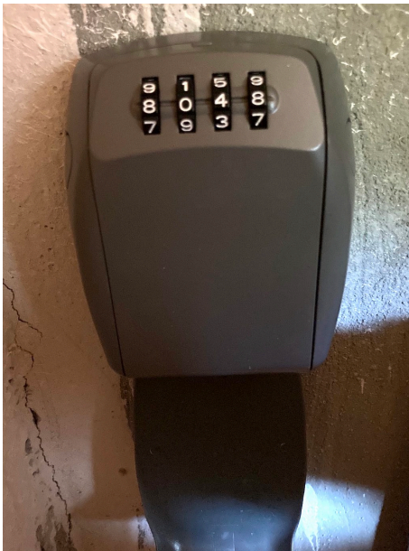
La boîte à clé