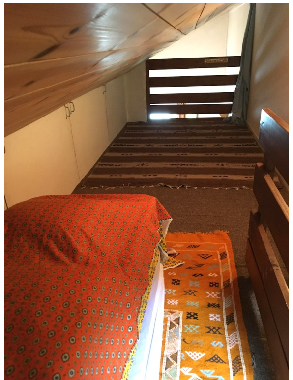
La mezzanine et ses matelas à même le sol