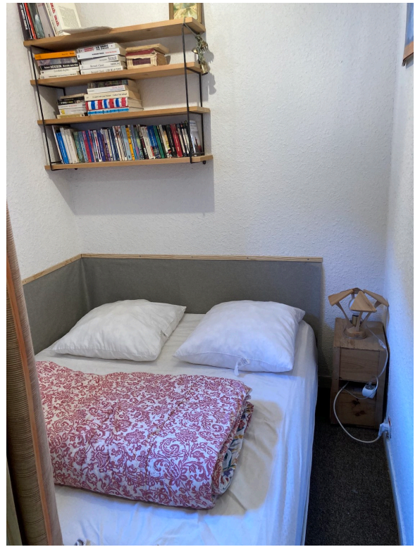
La chambre et le lit 140 x 190